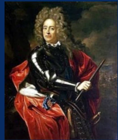
John Churchill I duca di Marlborough