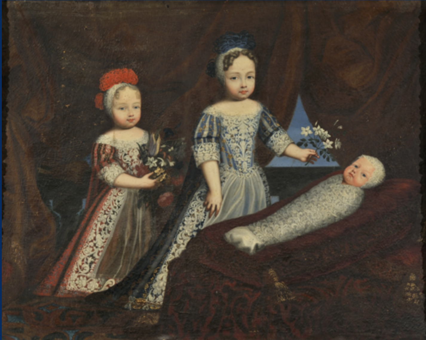
Tre fanciulli di casa Carron di San Tommaso Anonimo della fine del XVII secolo Santena, Fondazione Cavour