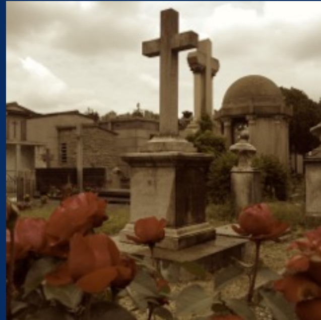
Cimitero Monumentale di Torino Tumulo 18