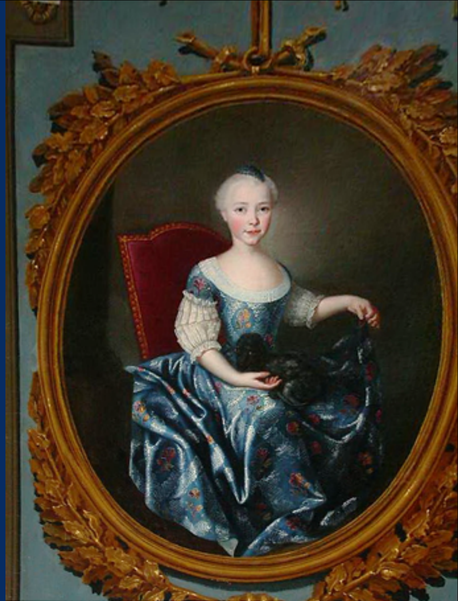
Fanciulli di Casa Carron di San Tommaso cerchia di Domenico Duprà Santena, Fondazione Cavour