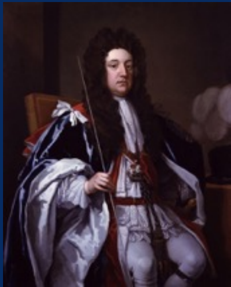
Sidney Godolphin, 1st Earl of Godolphin, by Sir Godfrey Kneller, Bt